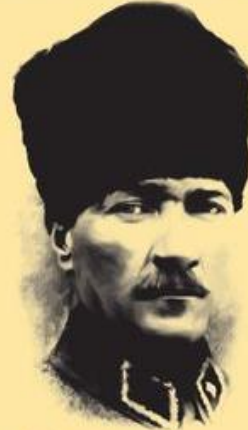
Mustafa Kemal Atatürk 20 Ekim 1927

Ey Türk istikbalinin evlâdı! İşte, bu ahval ve şerâit içinde dahi, vazifen; Türk İstiklâl ve Cumhuriyetini kurtarmaktır! Muhtaç olduğun kudret, damarlarındaki asil kanda mevcuttur!